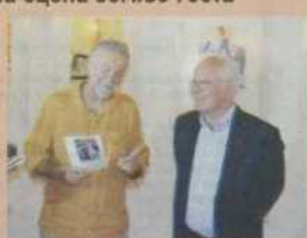
Изложба Жан Пјера Тангија

Величанственост и љепота перзана аутоматски инспиришу оного но воли природу, односно уметнике који се тиме баве - прокоментаришао је Танги.