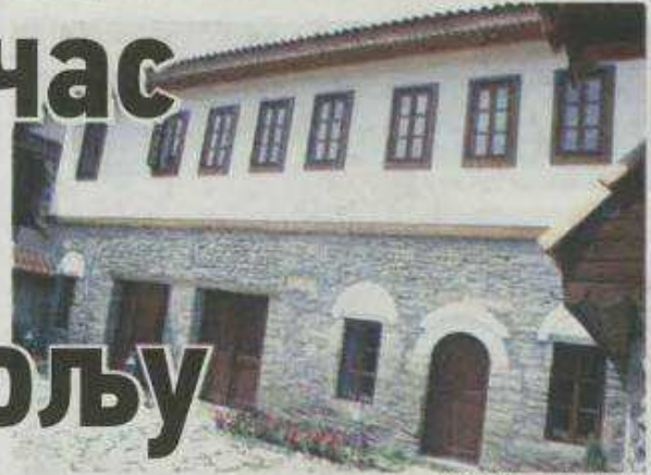
Кућа Риста Ратковића

Лозничке установе културе учествоваће на 46. „Ратковићевим вечерима поезије” у Бијелом Пољу од 3. до 5. септембра. Центар за културу „Вук Караџић”, КУД „Караџић”, Библиотека Вуковог завичаја и УГ „Реч и дело” из Лознице одржаће „Лознички сат културе” трећег дана манифестације, у Гимназији „Милоје Добрашиновић”, када ће Бјелопољцима приближити културни живот, историју и традицију Лознице и Подриња.