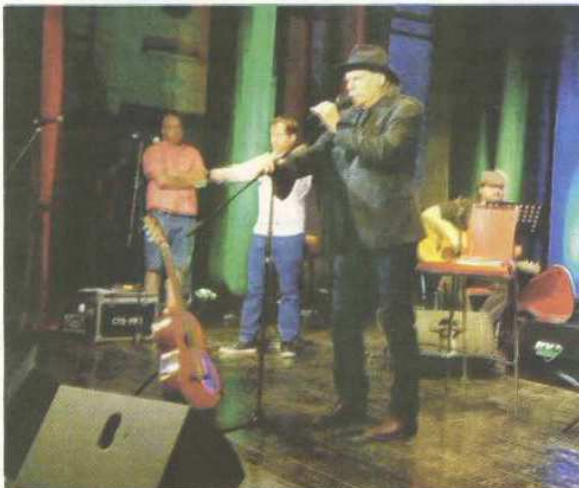
Specijalni gost večeri Ibrahima Hadžića bio je glumac Rade Šerbedžija

Hadžić koji već pola vijeka piše poeziju kazao je da njegov nastup ima poseban značaj, i zbog nagrade koju je dobio na prošloj manifestaciji.