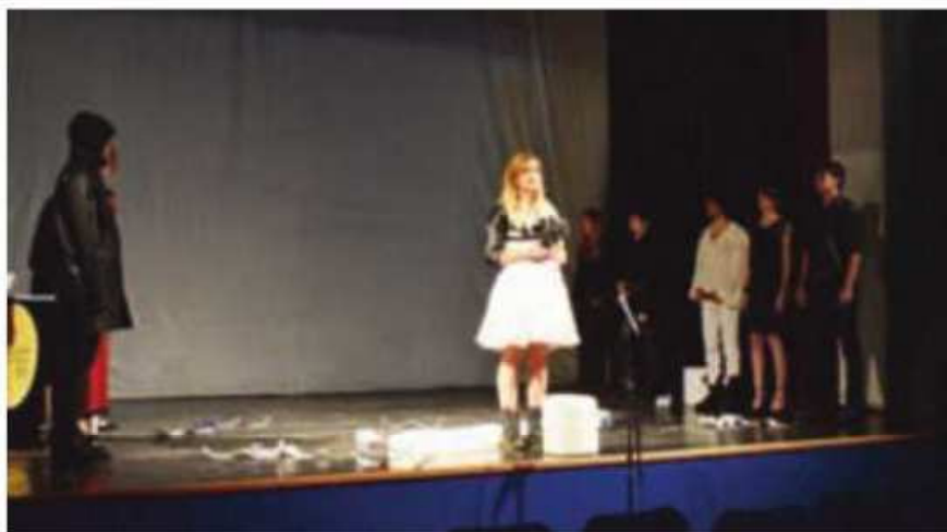
Sa predstavljanja Foruma mladih pisaca u Bijelom Polju

Kroz ovaj multimedijalni, performativni oblik predstavljanja pjesničkog stvaralaštva, književna i teatarska publika