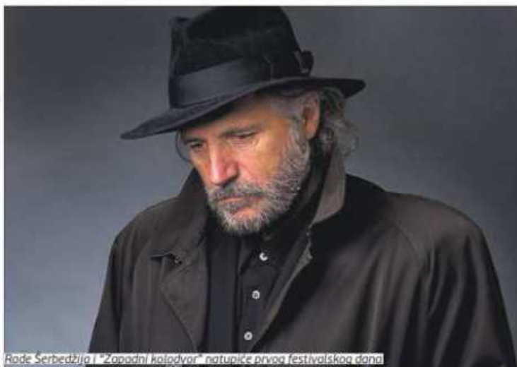
Rade Šerbedžija i "Zapadni kolodvor" nastupice prvog festivalskog dana