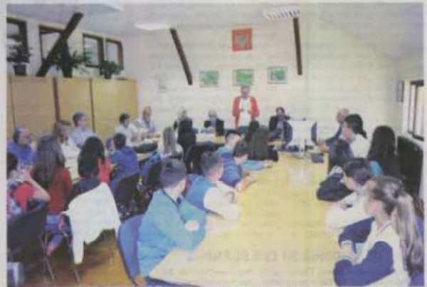
Пјесници у једној основној школи у Бијелом Пољу

– Дрети се много радуу подстица пјесника, зато што је Бијело Поље крај који воли поезију, то је град који треба