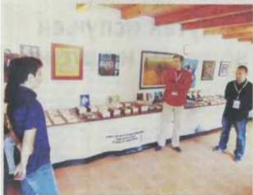
Са представљања Краљевчана и Новосађана